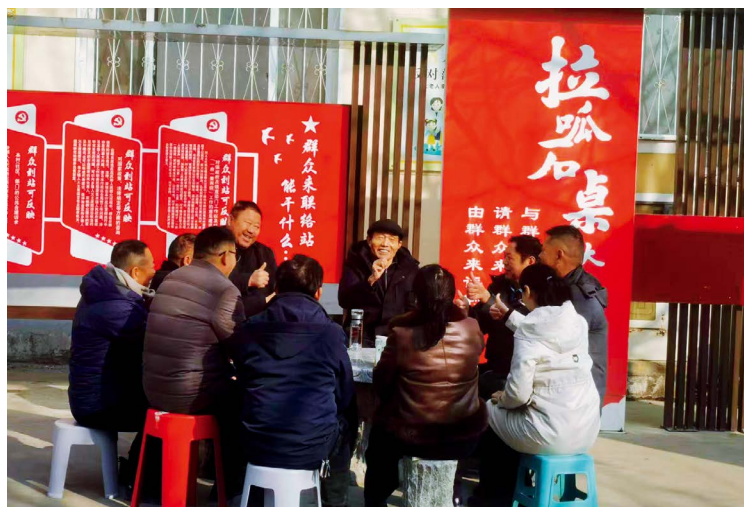
濮阳县庆祖镇“拉呱石桌”已成为人大代表收集民情民意的重要场所

民主决策新表现——民生实事项目人大代表票决制。 县乡人大积极探索推行民生实事项目人大代表票决制、乡村民生实事项目群众代表票决制(人大代表到场监督)，形成了完整的民主决策链条。一是群众“点单”，通过多种渠道广泛收集人民群众普遍关注的民生问题，提出民生实事项目议题；二是代表“定单”，由人大代表在人代会上对候选民生实事项目进行审议和投票表决；三是政府“办单”，由政府有关部门具体组织实施票决确定的民生实事项目；四是人大“督单”，由县乡两级人大组织专项监督小组对民生实事项目的实施情况进行监督；五是民主“验单”，由人大代表和群众代表对民生实事项目的完成情况进行满意度评价。