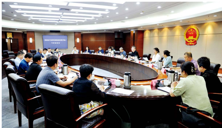
郑州市人大常委会组织召开《郑州市中医药发展促进条例(草案)》专家论证会

郑州作为岐黄文化的重要发祥地，发展中医药事业具有得天独厚的优势。近年，郑州市锚定中医药强市目标，出台了一系列政策措施，扎实做好岐黄文化保护、发掘、传承工作，加快构建中医药高质量发展产业生态。同时，中医药事业发展也面临着服务体系需进一步完善、产业竞争力有待提升、人才梯队建设需加强、文化认同感需深化等问题。如何将实践探索的宝贵经验固化为制度成果？如何破解制约中医药发展的瓶颈问题，更好地满足人民群众日益增长的健康服务需求？答案就是制定一部贴合郑州实际、彰显地方特色、兼具前瞻性与可操