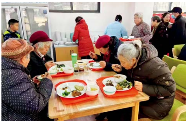
老人们在驻马店市驿城区西园街道助餐服务点用餐

办好代表建议。 坚持把老年助餐服务工作与人大代期间代表建议办理工作紧密结合起来，对5件涉及养老助餐服务的代表建议与专题调研期间代表反馈的意见和建议实行一体督办，组织人大代表参加三级联动专题调研、建议督办等活动，督促责任部门认真办理代表建议，及时回应人民群众对老年助餐服务的新期待。目前，5件代表建议已全部办结，实现以高质量提、高质量办助推养老服务工作提质增效的目标。