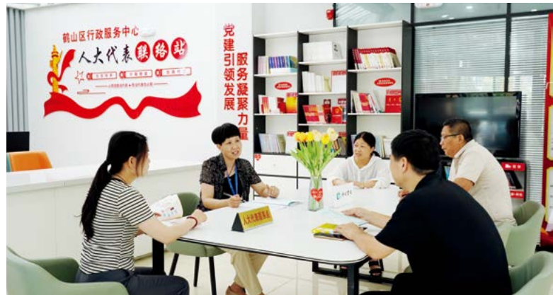
人大代表在鹤壁市鹤山区行政服务中心大厅接待群众

专业化分组提升治理精度。鹤山区立足辖区化工企业多、治理难点多的实际，精准组建矛盾纠纷调解、安全环保监督、营商环境优化和公正司法促进等专项代表小组，实现“专业人办专业事”。矛盾调解代表小组聚焦征地拆迁、“双拖欠”等领域，已化解纠纷13起。在赵家厂村征地拆迁纠纷中，人大代表连续3天驻村走访，促成村委会与8户村民达成补偿协议，化解了持续半年的信访积案。安全环保代表小组针对危化品企业密集的特点，监督推动有