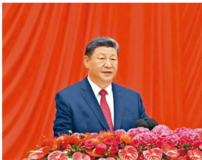
9月30日晚，庆祝中华人民共和国成立76周年招待会在北京人民大会堂举行。中共中央总书记、国家主席、中央军委主席习近平出席招待会并发表重要讲话。

庆祝中华人民共和国成立76周年招待会9月30日晚在人民大会堂举行。中共中央总书记、国家主席、中央军委主席习近平出席招待会并发表重要讲话。他强调，实现中华民族伟大复兴是前无古人的伟大事业。憧憬和挑战，都激发我们只争朝夕、永不懈怠的奋斗精神。我们要更加紧密地团结在党中央周围，锐意进取、埋头苦干，奋力谱写中国式现代化更加绚丽的篇章。