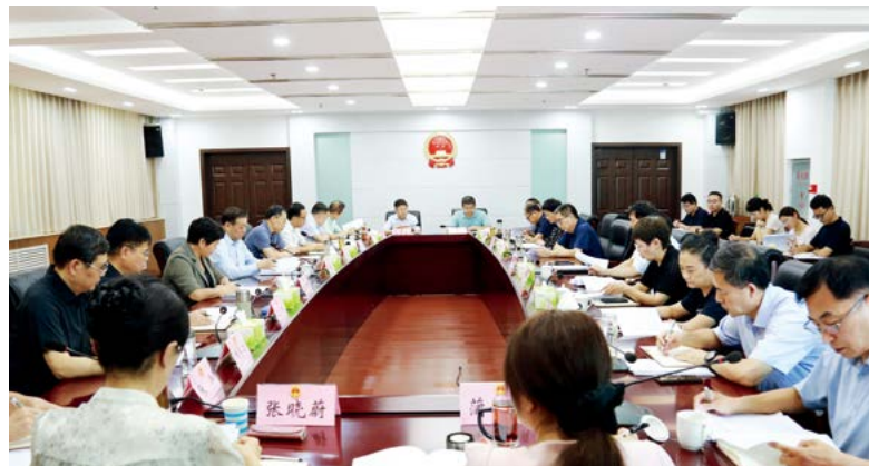
漯河市八届人大常委会第61次主任会议（党组）扩大会议召开

从严纠治思想认识偏差。定期开展日常谈话、专项检查，结合“三会一课”、主题党日等活动，深入把握市人大常委会机关党员干部在重大原则、重大问题上的立场态度，及时发现并纠正苗头性、倾