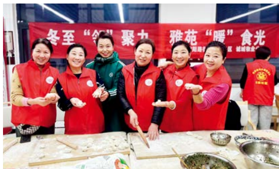
志愿者在鹤壁市淇滨区黎阳路街道长城社区老年食堂开展献爱心活动