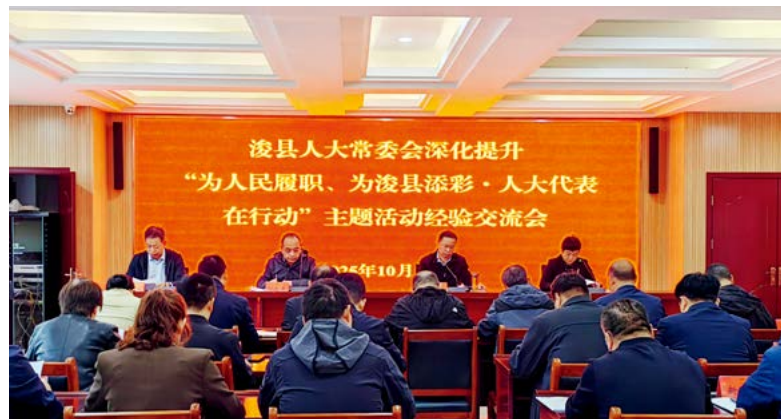
浚县人大常委会召开代表主题活动经验交流会

发挥专业代表优势。产业专业代表小组通过“问诊把脉、开方治病、输血补气、强筋壮骨”等举措，为产业链延链、补链、强链注入新动能。截至目前，已开展代表进车间活动7次、举办“代表·部门·企业面对面”座谈活动5次，收集企业诉求28