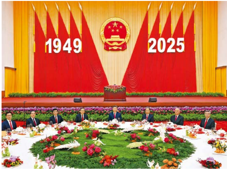
9月30日晚，庆祝中华人民共和国成立76周年招待会在北京人民大会堂举行。习近平、李强、赵乐际、王沪宁、蔡奇、丁薛祥、李希、韩正等党和国家领导人与中外人士欢聚一堂，共庆中华人民共和国华诞。

着力保障和改善民生，纵深推进全面从严治党，党和国家各项事业取得新进展、新成效。下个月，我们党将召开二十届四中全会，研究制定“十五五”规划建议。要紧紧围绕新时代新征程党的中心任务，把“十五五”发展的目标任务和战略举措规划好、实施好，确保基本实现社会主义现代化取得决定性进展。