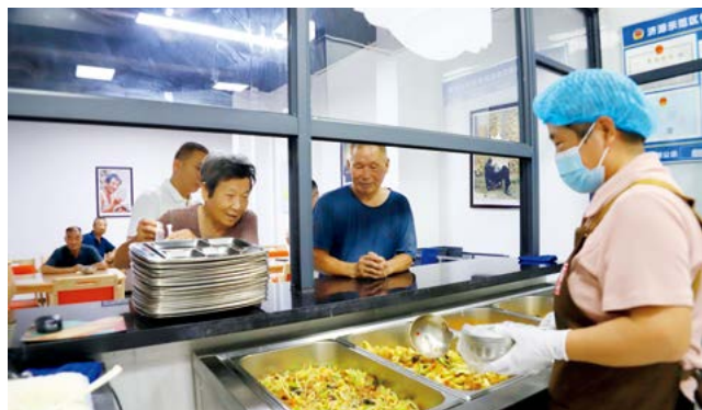
老人们在济源市沁园街道邱礼庄供销食堂就餐

一餐热饭，关乎广大老年人的晚年幸福。开展老年助餐服务，是既解决老年人基本需求又提升老年人生活品质的一项重要民生工程。济源市人大常委会聚焦养老服务，坚持上下联动聚合力，构建起闭环监督体系，召开老年助餐联动监督工作专题会议，成立老年助餐联动专题调研领导小组，组织16个镇、街道聚焦老年助餐设施布局、服务模式、扶持政策、服务供给、服务监管等方面开展调研，全面了解老年人的助餐服务需求以及助餐机构运行现状。针对调研发现的问题，坚持“清单式”问题追踪，采取“边调研、边反馈、边整改”的方式，形成