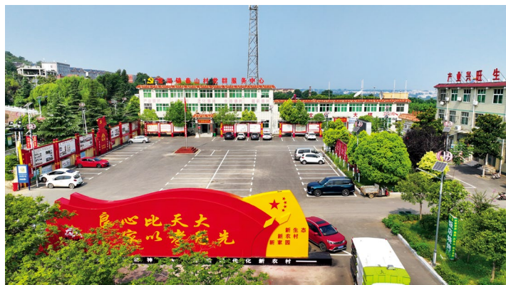
泰山村党群服务中心