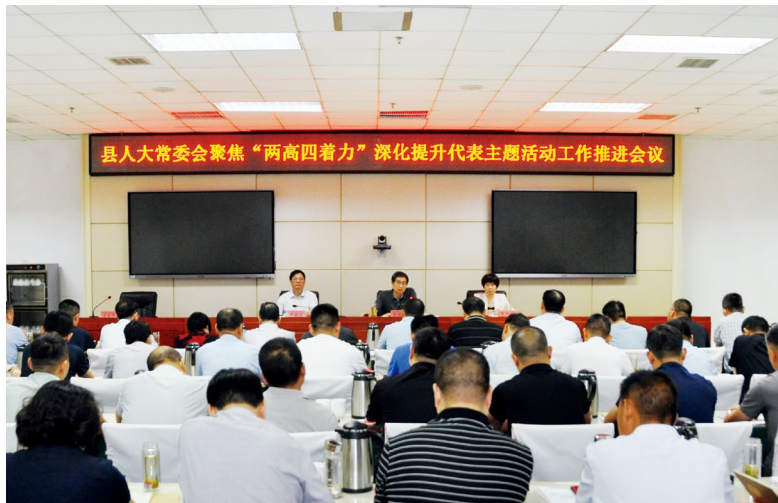
固始县人大常委会召开聚焦“两高四着力”深化提升代表主题活动工作推进会议

护、住宅小区物业管理等群众反映的突出问题，组织人大代表以视察、调研、询问等方式，深入一线和问题发生地查看情况、了解实情，结合本地实际，就加强城区公园水体水系保护、加强住宅小区治理作出决定。围绕城市精细化治理、电梯安全等热点问题，组织人大代表积极建言献策，并以联组会议的形式对市场监管、住建等部门开展电梯安全专题询问，确保人民群众“上上下下的安全”。聚焦生态环保，找准“小切口”，开展“四个一”（作出一个加强城区公园水体水系保护的决策、专题听取一次生态环保代表建议办理情况的报告、组织一次黑臭水体治理专题询问、开展一次大气污染防治专题视察）专项行动，努力把社会期盼、代表智慧和基层经验转化为加强和改进生态环保工作的真知灼见。