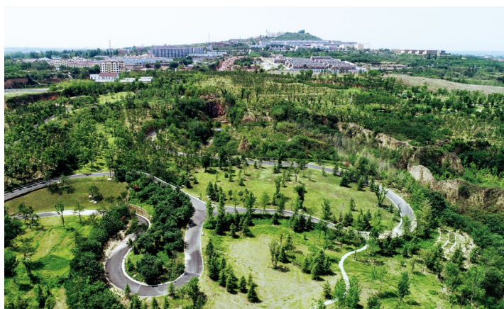
泰山村生态森林公园桃花源