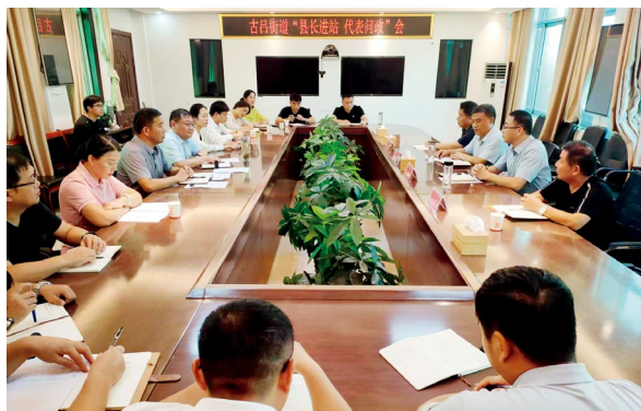
新蔡县古吕街道开展“县长进站 代表问政”活动

以学习研讨促转化。坚持“活动+培训”并行。在4月、5月全县人大代表联络站活动月围绕新修改