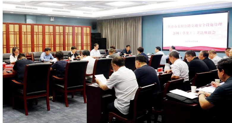
焦作市人大常委会召开《焦作市农村公路交通安全设施管理条例(草案)》立法座谈会

为有效预防和减少交通事故、补齐民生安全短板，焦作市人大常委会多次组织专题调研，督促公安、交通运输等有关职能部门深入开展农村路口源头治理，探索推行“四同步”(农村公路交通安全设