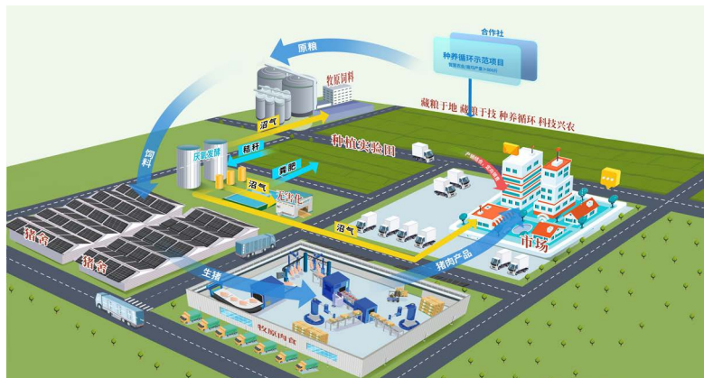
牧原集团种养循环模式示意图

未来，牧原集团将继续深耕主业，不断深化联农带农机制、强化绿色技术创新，在乡村振兴与农业现代化的征程中展现新担当、实现新作为，为中原大地推进中国式现代化贡献更多产业力量。