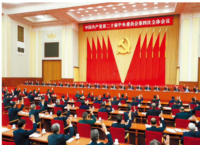
中国共产党第二十届中央委员会第四次全体会议，于2025年10月20日至23日在北京举行。中央政治局主持会议。新华社记者 丁海涛 摄