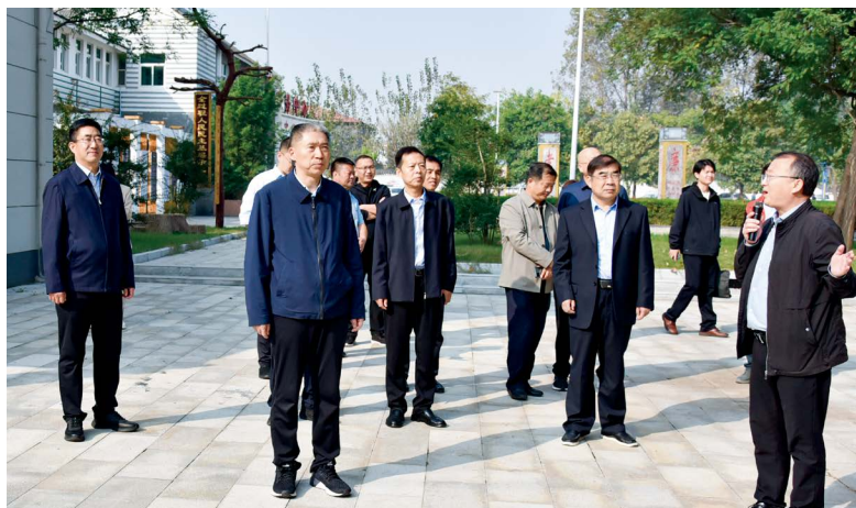
平顶山市人大常委会主任张明新带队到舞钢市调研人大代表联络站助力基层高效能治理工作

用标准化促规范。迭代升级全市273个代表联络站，推动联络站建、管、用标准化，践行高质量联系和服务群众的承诺。一是优化站点布局。坚持贴近选民、方便代表原则建站，全面优化代表联络站、全过程人民民主基层实践点和基层立法联系点，构建布局合理的“家站点”工作阵地。对位置偏远或不便于群众参与活动的阵地场所，通过置换或设置流动站等办法，转移到人流密集场所设站办点，做到方便代表联系群众、方便群众找到代表、方便交互开展活动。二是明确服务配置。完善履职