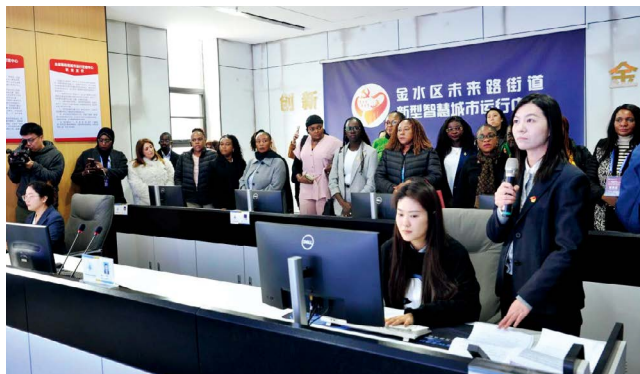
来自非洲8个国家的40位女议员到郑州市金水区未来路街道人大代表联络站现场观摩

破解“双网”融合难题，是提升治理效能的关键。未来路街道创新构建人大代表联络站网格与基层治理网格深度融合的组织体系，建立代表联络站站长、人大代表、居民议事代表与一、二、三级网格长层级并行、职责呼应的工作架构，形成“群众反映→代表收集→平台分办→部门处置→结果反馈→群众评价”的闭环机制，真正实现人大代表“履职在网格、服务在网格、作用发挥在网格”。这一机制的实施让人大代表从“定期坐班”变为“常态下沉”、从“被动等待”转为“主动发现”，让代表联络站真