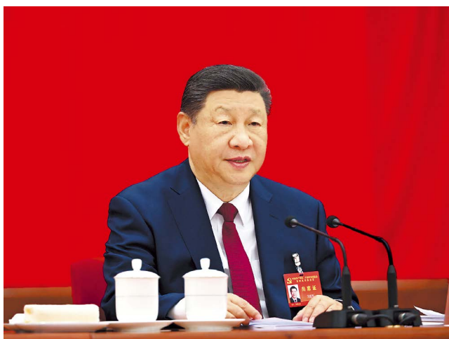
中国共产党第二十届中央委员会第四次全体会议，于2025年10月20日至23日在北京举行。中央委员会总书记习近平作重要讲话。

全会号召，全党全军全国各族人民要更加紧密地团结在以习近平同志为核心的党中央周围，为基本实现社会主义现代化而共同奋斗，不断开创以中国式现代化全面推进强国建设、民族复兴伟业新局面