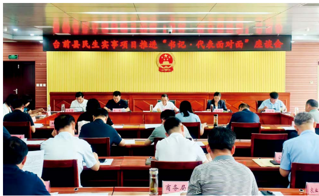
台前县民生实事项目推进“书记·代表面对面”座谈会