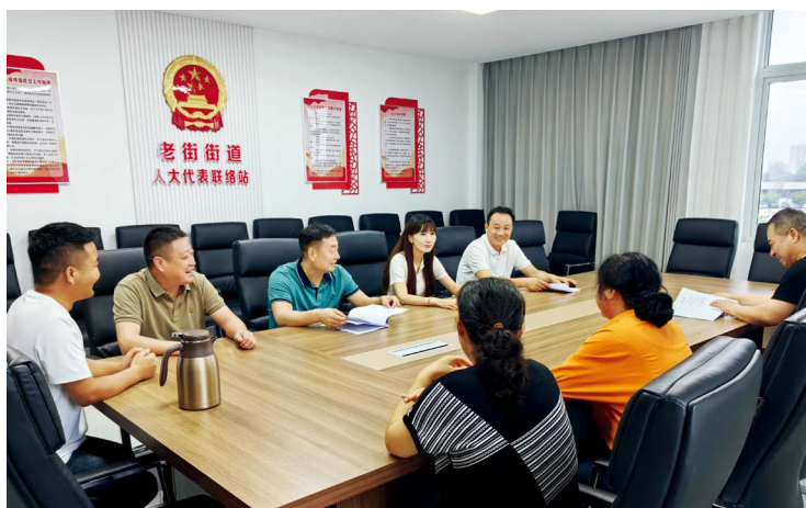
驻马店市驿城区老街街道人大工委积极探索“人大代表+”矛盾纠纷化解新模式，实现了人大代表与选民之间“零距离”接触