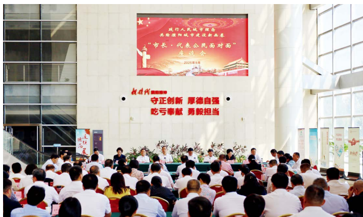
濮阳市人大常委会组织召开“市长·代表公民面对面”座谈会征求意见、建议

严格请示报告，与党委同频共振。市人大常委会党组将严格执行重大事项请示报告制度作为确保人大工作与党委中心工作同向发力的关键环节，形成常态化机制：会前，主动将会议议程、议题安排特别是涉及重大事项、