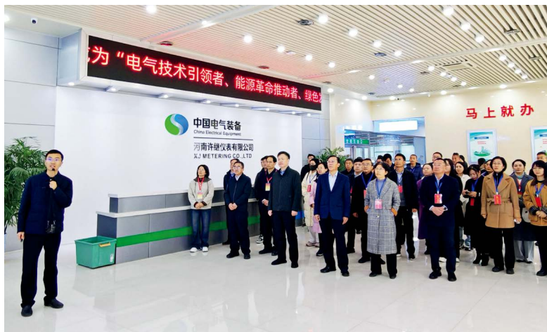
许昌市人大常委会组织代表到中原电气谷调研

统筹规划代表履职活动。主动加强与“一府一委两院”的沟通对接，统筹规划市人大常委会、市“一府一委两院”邀请代表参加活动安排，推动代表履职场景更加开放、多元。2025年，先后组织人大代表参加城市规划座谈会、公共法律服务开放日、共青团与代表面对面座谈会等活动10余场次，并参与法院庭审旁听、检察公益诉讼调查等实践活动，实现“沉浸式”履职，为代表精准建言和有效监督创造条件。