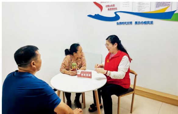
议政代表在“姊妹调解室”参与矛盾纠纷调解

自潘河街道人大工委创新开展“代表说事”活动以来，代表们不再满足于在联络站等待群众来访，而是主动走出来，通过“敲门行动”“广场夜话”“代表夜访”等形式下沉选区收集群众的急难愁盼问题。在“代表说事”活动的推动下，辖区的路灯点亮、道路修复、破损墙面修复、运动场地整修、居民健身设施添置等20多件民生“微实事”得到及时、有效解决。