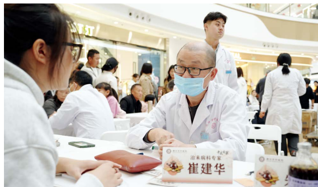
周口市中医院专家团队开展中医药惠民服务

2024年4月，周口市被国家中医药管理局确定为国家中医药传承创新发展试验区，迎来政策叠加、机遇齐聚的历史发展黄金期。“以紧密型县域医共体建设为载体，围绕中医药传承创新发展，以人民群众健康需求为导向，完善中医药发展的体制