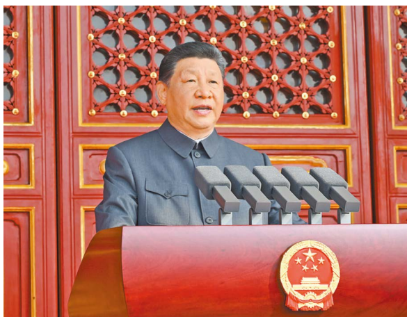
9月3日，纪念中国人民抗日战争暨世界反法西斯战争胜利80周年大会在北京天安门广场隆重举行。中共中央总书记、国家主席、中央军委主席习近平发表重要讲话。

李强主持 赵乐际王沪宁蔡奇丁薛祥李希韩正出席 61位外国领导人及有关国家高级别代表、国际组织负责人、前政要等应邀出席大会