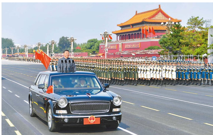
9月3日，纪念中国人民抗日战争暨世界反法西斯战争胜利80周年大会在北京天安门广场隆重举行。这是中共中央总书记、国家主席、中央军委主席习近平检阅受阅部队。