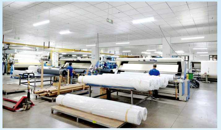
公司智能面检车间