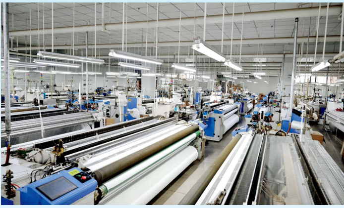
公司智能织造车间