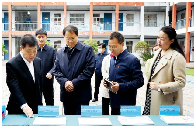
焦作市人大常委会开展《焦作市中小学校幼儿园安全条例》立法调研

怀川大地独特的自然和文化资源禀赋呼唤独特的法治保障。焦作市人大常委会围绕区域协调发展的目标，探索出台《焦作市全域旅游促进条例》，推动“太极故里·山水焦作”加速融合；出台《焦作市国土空间规划管理条例》，确保“一张蓝图绘到