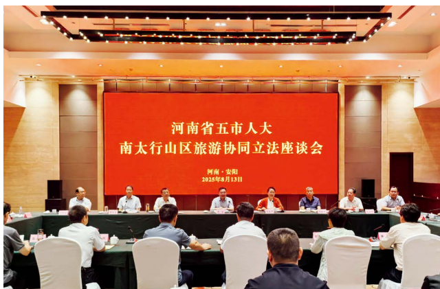
河南省五市人大南太行山区旅游协同立法座谈会在安阳召开

低空经济作为新质生产力的重要载体和战略突破口，已成为推动安阳高质量发展的重要引擎。安阳是省委、省政府明确的全省低空经济发展重点布局城市之一。面对低空经济发展的黄金机遇期，安阳市人大常委会主动作为、精准发力，依法助力低空经济“飞”得更稳、更高、更远，为市域高质量发