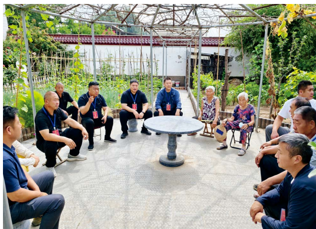
开封市祥符区陈留镇人大代表参加“小板凳”议事会

代表“动起来”（60分）：聚焦代表核心履职效能的发挥，细化为六大类活动，每类设定基础量化指标（如最低活动次数）作为“起评分”，鼓励超额完成。一是“双联系”活动（10分），要求代表每月至少联系1次选民，常委会组成人员联系基层代表常态化，重点是联系记录的真实性、完整性和问题反馈情况；二是专项调研活动（10分），围绕中心工作和民生关切每年至少组织2次有深度的专题调研，重点是选题价值、调研深度、报告质量和建议转化；三是集中视察活动（10分），聚焦重大项目和民生实事每年至少组织2次，重点是对象选择、代表参与度、发现问题及推动解决成效；四是执法检查活动（10