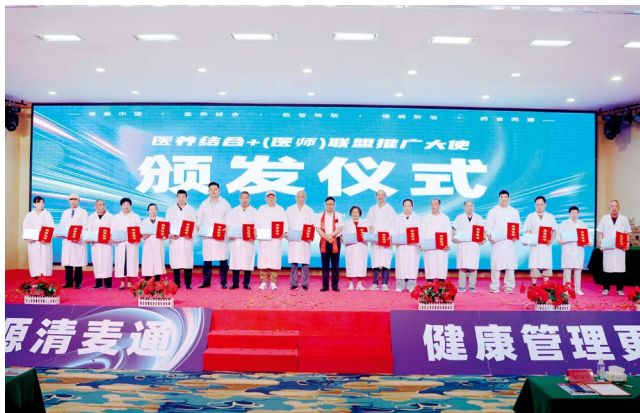
“清麦通医养结合+医师联盟推广大使”证书颁发仪式

慈善事业是中国特色社会主义事业的重要组成部分，对促进社会公平正义、推动实现共同富裕具有