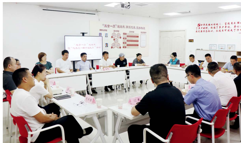
郑州市金水区凤凰台街道开展“三官一员”进站点暨“代表统一接待选民日”活动

开展法治宣传教育。 公、检、法、司工作人员下沉到站点和街道社区,通过普法宣传讲座、播放自制微电影等形式开展法治宣传教育,推进全民遵法、学法、知法、用法、守法;参与“代表统一接待选民日”活动,现场解答物业纠纷、邻里矛盾、合同纠纷、识别防范电信网络诈骗进行普法宣讲,就相邻权、民间借贷、财产继承解答咨询;立足典型案例,分析如何防范和化解企业经营风险,深入企业