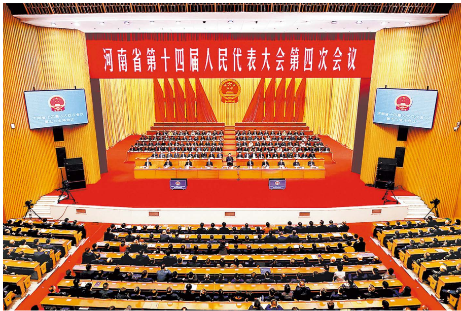
1月30日，河南省第十四届人民代表大会第四次会议圆满完成各项议程后在郑州闭幕。

1月30日，河南省第十四届人民代表大会第四次会议圆满完成各项议程后在郑州胜利闭幕。省委书记、省人大常委会主任刘宁主持会议并讲话。