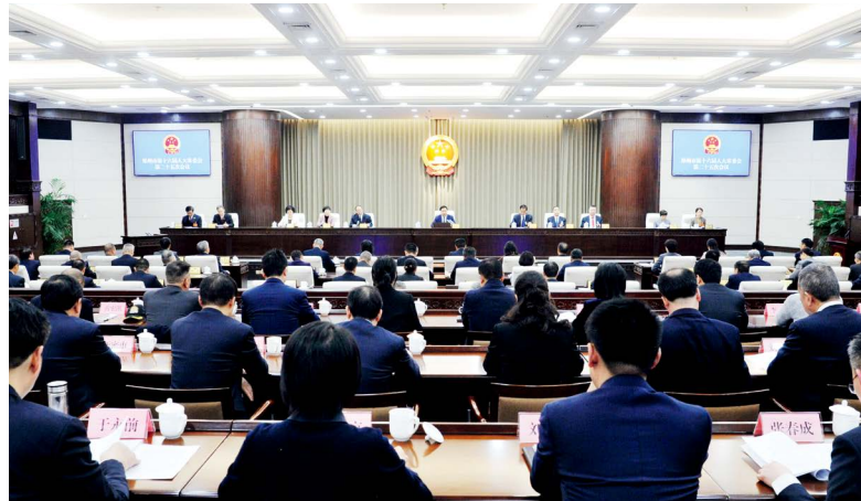
郑州市十六届人大常委会第二十五次会议审议“一府两院”备案审查工作情况报告

编制年度立法计划时，郑州市人大常委会认真落实市委提出的立法项目，紧扣全市经济社会高质量发展需要和广大群众的立法需求，合理配置立法资源，并将年度立法计划报请市委常委会研究讨论作为立法计划编制实施的必经程序，确保立法工作与市委部署协调配合。在具体法规项目审查修改中，准确领会市委立法意图，对法规案涉及重大制度设计、重要事项或者重大利益格局调整的情况，及时请示汇报，确保市委和市人大常委会党组及时、准确掌握立法动态，增强立法工作的原则性和