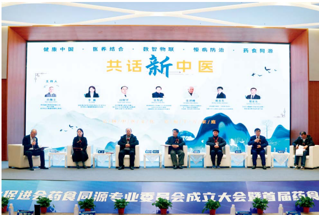
诸多专家参与分享《共话新中医》主题活动

清麦通立足“患者为药、健者为食，应用相同、溯本追源”的药食同源本质，深耕心脑血管健康细分赛道，打造出极具差异化的慢病干预产品“清麦通健康管理方案”，树立起药食同源产品专业化研发的标杆。不同于普通保健品或常规药品，清麦通通过“天然食材+现代中医+精准干预”的融合路径，精选人参、山楂、白果、酸枣仁等道地药食同源食材，精准对接我国3.3亿心脑血管疾病患者及亚健康人群的健康需求。公司坚持以全产业链思维构建从源头食材把控到终端产品交付的全程可控体系，为后续产业规模化发展打下坚实基础。清麦通深知药食同源的价值不仅在于产品本身，更在于如何让药食同源理念落地为民生服务。