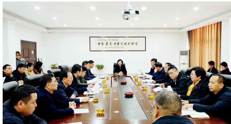
禹州市人大常委会在中医药产业人大代表联络站召开代表建议办理答复会

政策导航，聚合发展合力。推动市人民政府出台《禹州中医药产业发展专项行动规划》，成立中医药产业转型升级工作专班，确立“抓中间、带两头”的发展思路，统筹种植、加工、流通、文旅全产业链发展。依托中医药产业人大代表联络站的资源优势，督促组建中医药专业科技特派员队伍，搭建科研院所与企业对接的桥梁，已协调企业引进博士12名，推动成立河南省道地中药产业创新研究院，培育润弘本草、盛世联邦等省级“智能车间”企业，助力华夏药材、盛世联邦申报“博士后创新实践基地单位”，扶持华夏药材等一批省市级龙头企业成长，推动禹州中医药产业向标准化、智能化、绿色化、品牌化方向稳步迈进。