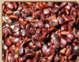
酸 枣 仁