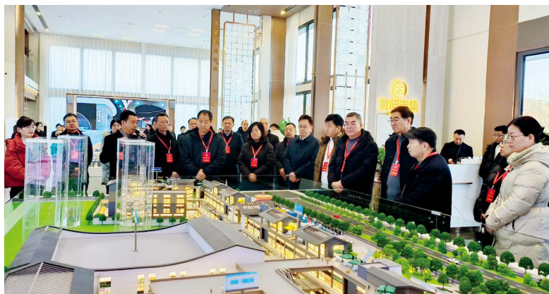
洛阳市偃师区人大常委会组织代表视察议案建议办理情况

在民生领域精准回应群众关切。在交通出行方面，优化802路公交与地铁衔接并增设夜间返程班次，落实老年人乘坐公交车优惠政策；在医疗保障方面，实现医保服务网点全覆盖，创新村卫生室线上采购模式并开通门诊统筹系统；在农业安全方面，通过宣传培训、执法检查筑牢农产品质量防线。