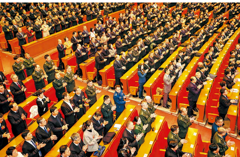
1月30日，圆满完成各项议程后，河南省十四届人大四次会议在省人民会堂闭幕。