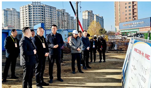
新郑市人大常委会组织代表视察南关桥建设情况

联络互动，优化办理方法。各承办单位按照“办前协商、办中沟通、办后回访”的要求，主动加强与代表的联系，增进良性互动，邀请代表全程参与建议办理工作，了解代表提建议的具体意图，共同研究解决办法。在办理过程中，变“你提我答”为