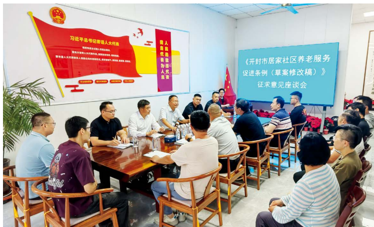
开封市龙亭区四季城人大代表联络点开展征求立法意见征集活动

精心选点布局。结合区域特点和立法需求，在全市设立21个基层立法联系点，涵盖乡镇人大（政府）、行政执法部门、历史文化研究机构、社区乡村和律师协会，实现地域分布全覆盖、重要行业系统全覆盖。延伸基层触角，在园区、广场等区域设立立法信息采集点，织密横向到边、纵向到底、上下联动的立法信息采集网络。市人大常委会坚持以立法信息员为主体、以人大代表为依托、以专家咨询库为支撑，通过用好“三支队伍”，推动基层立法联系点工作大众化、多元化、专业化，借力、借智提升立法质量。城乡一体化示范区人大工作联络处依