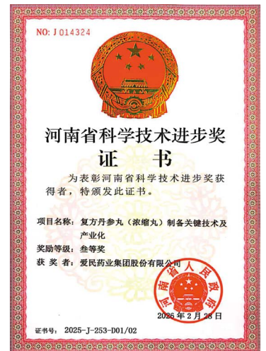
爱民药业荣获河南省科学技术进步奖

近年，爱民药业先后通过质量、安全、环境职业健康、能源管理体系、GMP质量管理体系认证，是中国AAA级信用企业、中国时代十大创新示范企业、中国品牌企业500强、河南省五一劳动奖状获得者，先后被评为河南省博士后创新实践基地、河南省药品安全质量标杆企业、河南省绿色工厂、河南省中药提取生产智能车间、河南省中药生产智能工厂、新一代信息技术融合应用新模式示范项目、河南省“专精特新”中小企业、河南省技术创新示范企业、河南省企业技术中心、河南省工程研究中心（复方丹参方剂工程研究中心）、河南省知识产权优势企业、国家知识产权优势企业、“十四五”科技创新示范单位，并获得科技创新优秀发明成果（技术）和国家重点研发专项等荣誉。