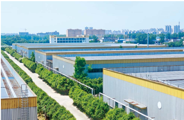
爱民药业厂区一角

爱民药业深入践行绿色发展理念，按照“厂房集约化、原料无害化、生产洁净化、废物资源化、能源低碳化”标准，全面推进绿色改造与节能降碳。升级老旧用能设备，建立能耗在线监测系统，实时监控能耗、管控排放，强化全过程绿色管控，减少污染物排放，提升资源利用率，实现低碳环保生产。2023年，获评省级绿色工厂和省级中药生产智能工厂，实现智能制造与绿色制造深度融合，为行业绿色低碳转型提供了可复制经验。从智能产线到数字管控，从绿色车间到低碳生产，爱民药业以技术革新推动产业升级、