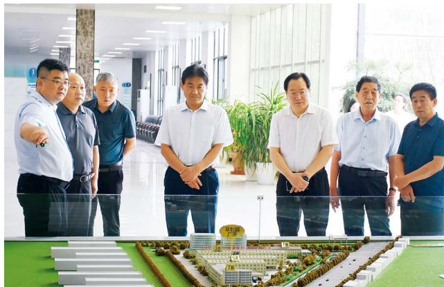
新乡市人大常委会调研重点产业发展和产业代表联络站建设情况

导下，统筹指导县乡人大换届选举，检查《河南省乡镇人民代表大会主席团工作条例》《河南省街道人大工作条例》贯彻实施情况，支持、指导基层健全完善居民议事会制度。鼓励、指导县乡人大在畅通民意表达、破解民生难题、赋能基层治理等方面积极探索，在乡村、社区开展“板凳议事”“广场夜聊”等创新实践，深化拓展全过程人民民主基层实践案例交流活动，让全过程人民民主更加可感可及。