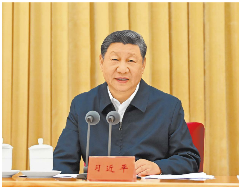
7月14日至15日，中央城市工作会议在北京举行。中共中央总书记、国家主席、中央军委主席习近平出席会议并发表重要讲话。