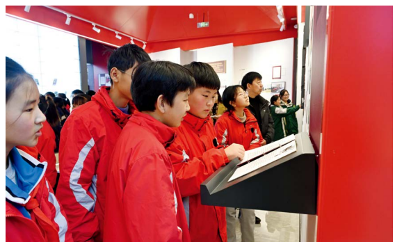
中小学生在辉县市冀屯镇全过程人民民主展览馆参观学习