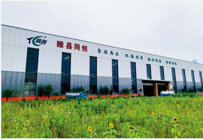
睢县同创主生产车间