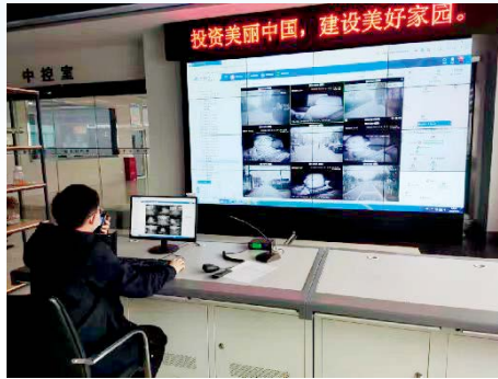
环卫一体化指挥调度系统