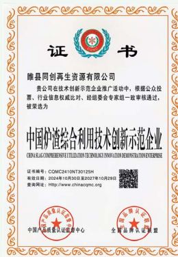
创新示范企业证书

目前，项目主要服务于睢县、宁陵两县垃圾焚烧发电炉渣综合处理工作，并在此基础上积极拓展商丘市、焦作市、开封市等周边区域的炉渣处理工作。自项目投产后，公司积极响应政府“万企兴万村”的号召，通过运营过程中的运输、生产、销售等产业链条，带动当地产业发展、提供就业岗位，进一步助力乡村振兴。