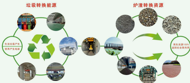
垃圾转换能源、炉渣转换资源流程