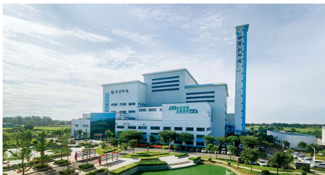
首创环境城乡一体化垃圾处理中心

首创项目的引进和高质量运行不仅较好地解决了睢县的城乡垃圾处理问题，也为群众提供了更多就业岗位，为建设美丽睢县、推进乡村振兴提供了坚实的支撑。2023年，在全省县区治理成效排名中，睢县荣获第一名。👍