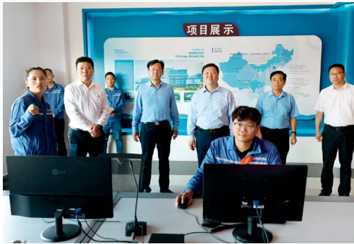
中共商丘市委书记李湘豫莅临项目调研

睢县首创项目公司计划总投资6.8亿元（一期3.8亿元、二期3亿元），致力于实现城乡垃圾一体化处理，是河南省第一家集清扫、收运及焚烧发电于一体的示范项目，打通了“清收运处一体化”产业链，从根本上实现了“村收集→乡转运→县处理”。其中，睢县垃圾焚烧热电项目总投资3.4亿元，于2018年4月开工建设，2019年8月投产，配置了2台日处理能力为300吨的机械炉排焚烧炉和1台12兆瓦的抽凝式汽轮发电机组。截至目前，已焚烧处理垃圾量约166万吨，年发电量约4.67亿千瓦时，年贡献税收1700多万元。睢县清扫保洁及收运一体化项目总投资4113万元，建成智能化环卫一体化指挥调度平台，负责全县20个乡镇的生活垃圾清扫收运工作，确保“日产日清”。项目在每个行政村设置1个垃圾桶收集点，配备垃圾桶4万多个，配备收运车辆55台、收运司机40名、保洁人员2123名，日收运垃圾330吨，年收运量约12万吨。项目坚持与政府精准扶贫相契合，按照不低于总人口2‰的标准配备保洁人员，优先招聘下岗职工和困难群众，已提供700多个脱贫攻坚岗。