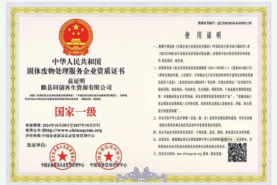
固体废物处理服务国家一级企业证书